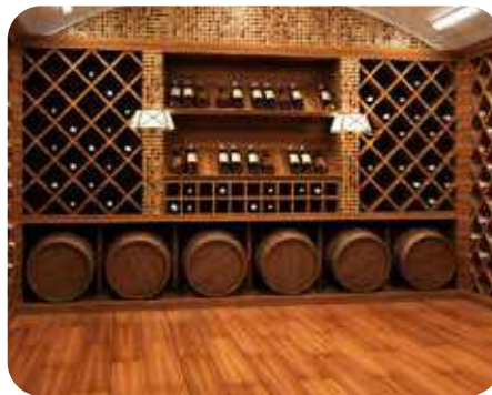
Bodega de Vinos