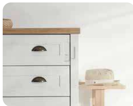
Bordes de cajones o mesas