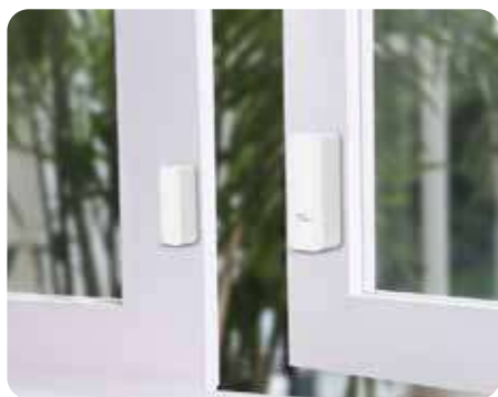
Bordes de las ventanas