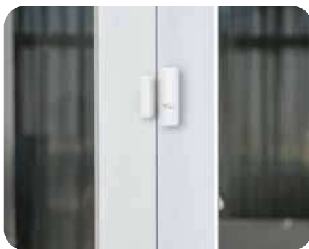
Bordes de las puertas